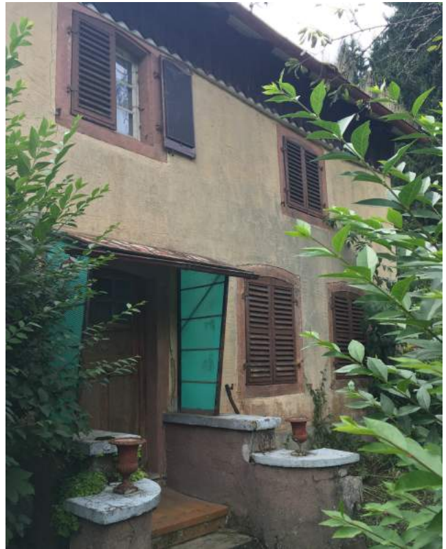
La maison de Grandfontaine en cours de vente

Ce statut permet aussi en déclarant la cotisation annuelle, de bénéficier d'une réduction d'impôts au titre des dons.