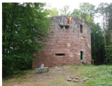
Klein Frankreich : une défense avancée de Berwartstein