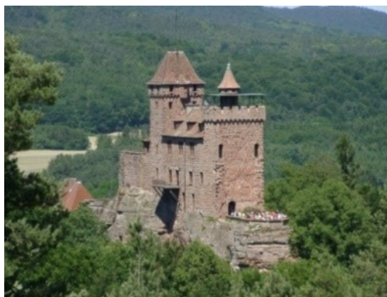
... et vue actuelle

Thèmes particuliers : Deux châteaux semi-troglodytiques, le second reconstruit et habité : Drachenfelsschloss et Berwartstein (plus le site attenant de Klein Frankreich) ; la partie supérieure du Drachenfelsschloss (maçonnerie disparue), peut se comparer directement à celle de Berwartstein.