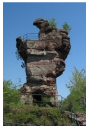
Drachenfels : vue d'ensemble et détails du rocher sommital (support du donjon)