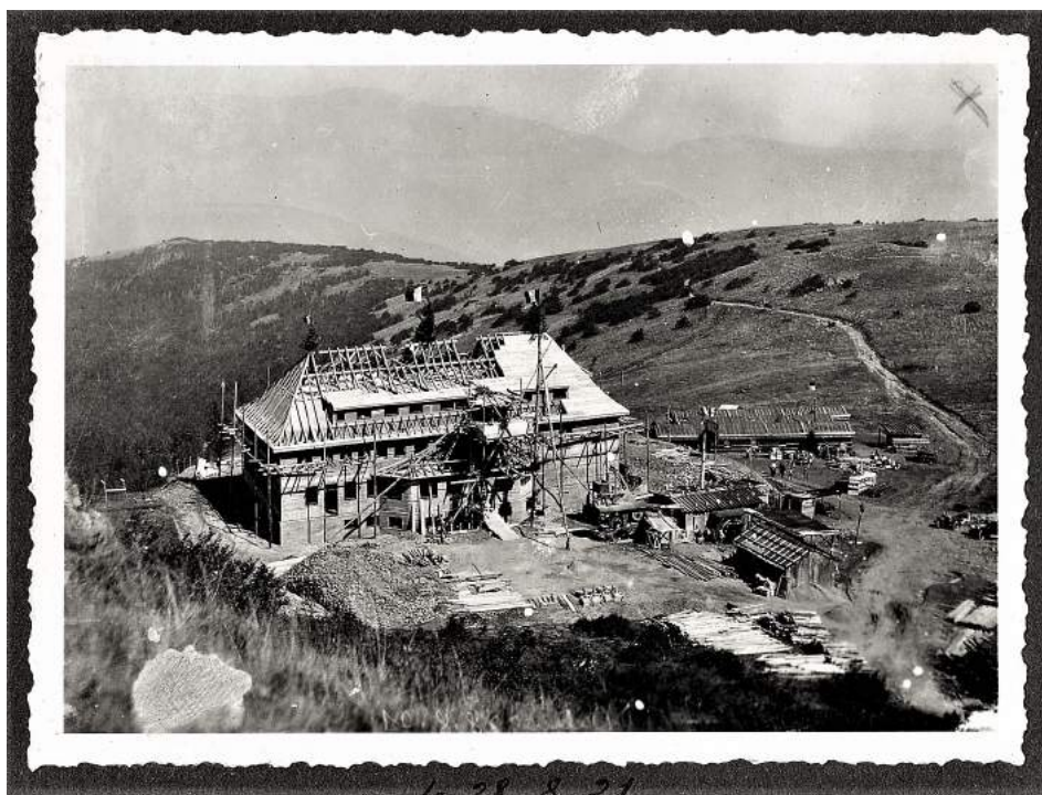
Construction en 1921

Un défi technique également, le bâtiment imaginé par l'architecte Théo BERST de Strasbourg possède une structure entièrement en béton. Une élévation de piliers et traverses en béton en forme l'ossature qu'entourent les murs extérieurs d'une épaisseur respectable. Les planchers sont également en béton avec des voûtes façonnées par des gabarits fabriqués sur place. Les séparations intérieures sont en briques.