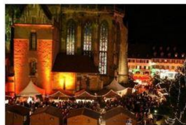
Le traditionnel marché de Noël de Thann DR

Noël à Thann 2019 : programme, dates et horaires