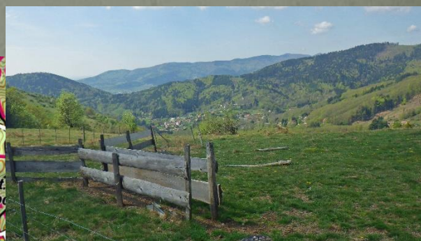
Vue sur le vallon de Bourbach depuis la crête du Kohlberg