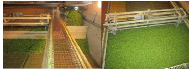
Le houblon arrive sur le séchoir.