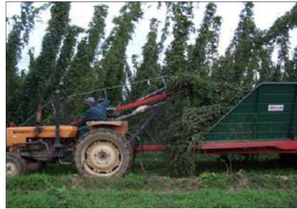
Une parcelle récoltée.

Les lianes sont arrachées sur le pied. Un tracteur muni d'une machine et suivi d'une remorque passe entre les poteaux de la parcelle. La machine coupe une liane avec son fil métallique, au pied et en saisit le bout, pendant que le tracteur poursuit sa route, arrachant la liane complète de son support. La liane ainsi libérée, tombe dans la remorque prévue.