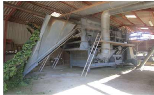
Arrivée des lianes à la trieuse.