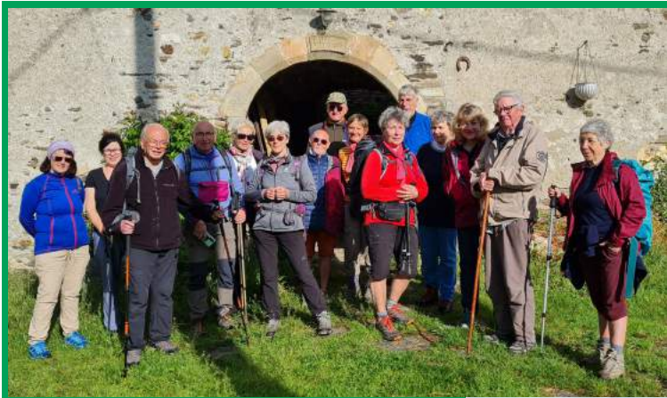
Une aventure au cœur de Cévennes

Le « Stanislas / Kléber » Trait d'union entre les 2 versants des Vosges